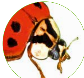
„W“ auf dem Kopfschild